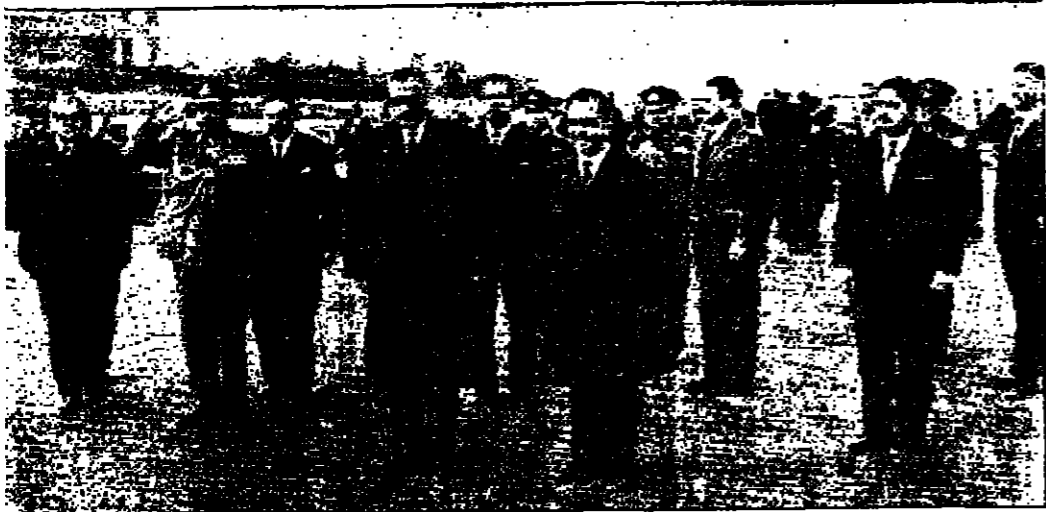
جلالة الحسين والرئيس عبد الناصر في وقت انشاء مطار القاهرة خلال عزم السلطان الملكي الاردني والجمهورية المصري .